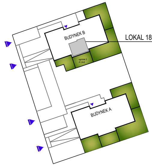
SCHEMAT RZUTU PARTERU