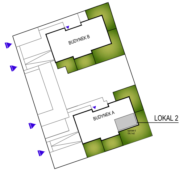
SCHEMAT RZUTU PARTERU