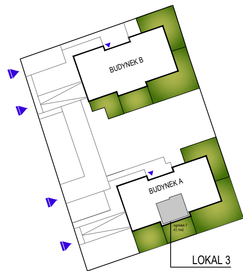
SCHEMAT RZUTU PARTERU